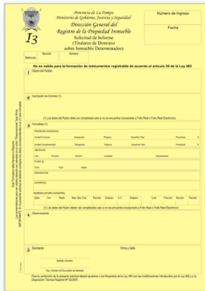
FORMULARIO I3 – SOLICITUD DE INFORME DE TITULARES DE DOMINIO SOBRE UN INMUEBLE DETERMINADO